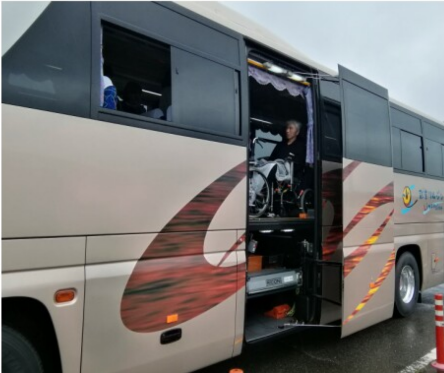
リフト付き大型バスを利用した介護施設のイベント旅行

リフト付き大型バスを利用した施設のイベントからご家族旅行、個人旅行まで介護付きの旅行はお任せください。無事故で15年を迎えました！