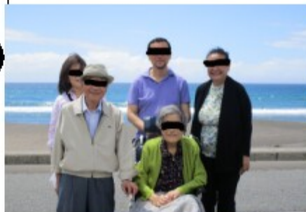
千葉県鴨川温泉へ 介護付き家族旅行