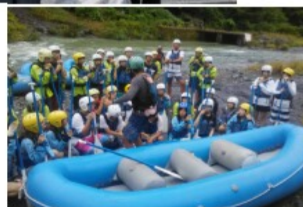
都内での高校生の ラフティング体験